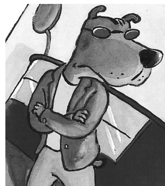
Der Coolnesstest im Brillenladen als Höhepunkt lustvoller Inszenierung alltäglicher, und doch kurioser Requisiten.

Die Geschichte einer innerstädtischen Hundeodyssee, die den Zusammenhang kleiner Ursprünge und großer Wirkungen humorvoll vor Augen führt.