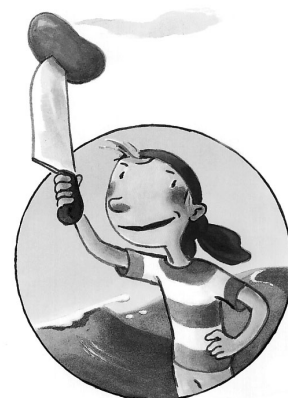
Ein Koch im Kapitänsrang, der mit Speckknödeln übt ...