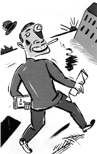
Leipziger Gedichte: Eine lyrischer und illustratorischer Streifzug durch ein Jahrhundert.

Womit wir wieder beim Thema wären. Denn natürlich gehört auch das Buch zu den Lebens-Mitteln und folgt dort ja unmittelbar auf das Brot. Und da Brote und Fische ja irgendwie zusammengehören steigt uns auch schon – Verflixt! Verflixt! Verflixt! – ein köstlicher Geruch in die Nase. Wie praktisch, dass Frühstücksbrettchen zu jeder Tageszeit verwendet werden können!