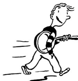
Ein nerviges Kerlchen auf dem Weg zum Kochduell.

Dass es zum Leben nicht nur Wasser und Brot, sondern auch Schuhe und Schule und Seife und Sonne braucht, zeigen kleine Gedichte und Geschichten, die sich an Kinder richten und deren Welt literarisch befragen.