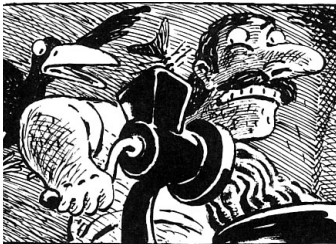
Hammerhai und Zitterrochen, Piratenwort wird nie gebrochen!