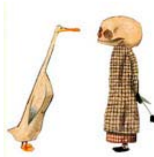
(aus: Erlbruch, W.: Ente, Tod und Tulpe. Kunstmann, 2007 )