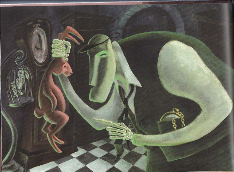
Aus: Schulz, Krejtschi: Die schlaue Mama Sambona . A.a.O.