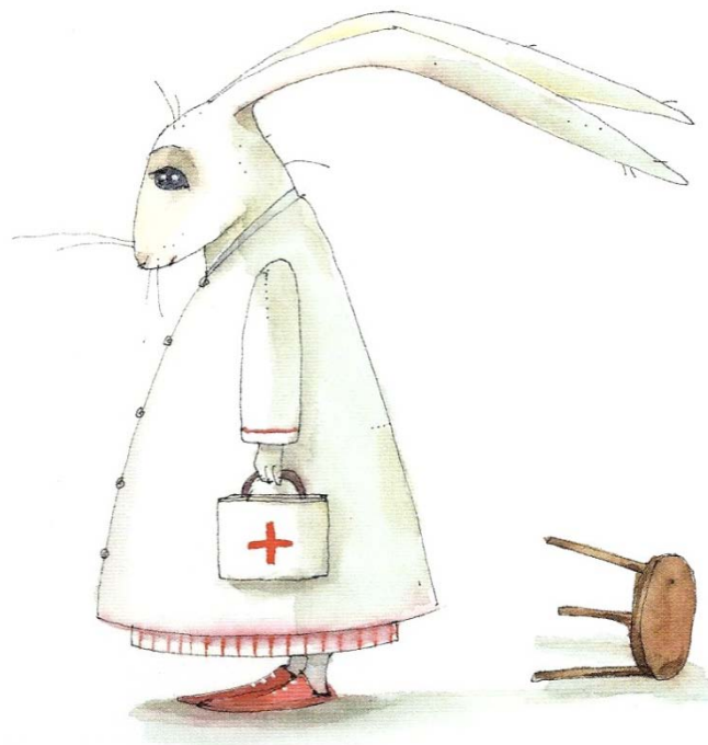
Aus: Meinderts, Jekkers, Grobler: Ballade vom Tod . A.a.O.