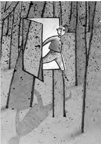
„Ich ging im Walde so für mich hin, ...“ Illustration zu Goethes „Gefunden“.