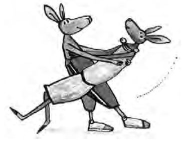
Ein Tänzchen gefällig?

Tierköpfe/-masken: Das Nachsatzpapier, auf dem zu sehen ist, wie die Kinder ihre Mäuseköpfe abnehmen, kann als Anregung aufgegriffen werden: Welchen Tierkopf male ich mir?