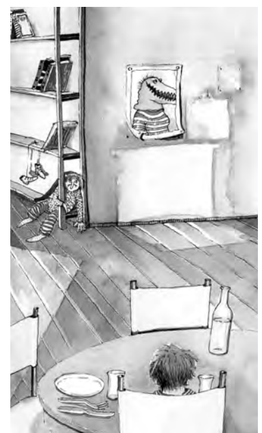
Illustration aus Nele Maar: Papa wohnt jetzt in der Heinrichstraße.