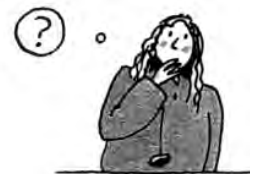
Illustration zu Paul Maar: In einem tiefen, dunklen Wald.